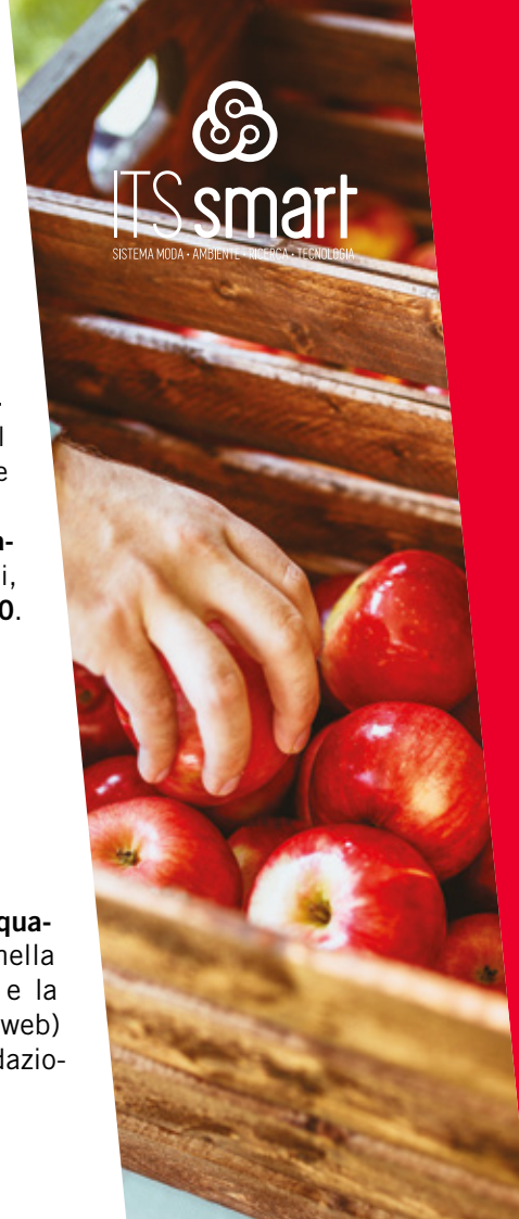
Figura professionale con competenze nell' organizzazione e gestione del controllo qualità dei processi di produzione e di trasformazione nella filiera agroalimentare , nella conformità agli standard nazionali e comunitari. Valida il processo produttivo e la funzionalità degli impianti. Conosce i mercati e le soluzioni innovative per il (web) marketing dei prodotti Made in Italy. Sovrintende alle pratiche doganali e alla redazione della relativa documentazione.